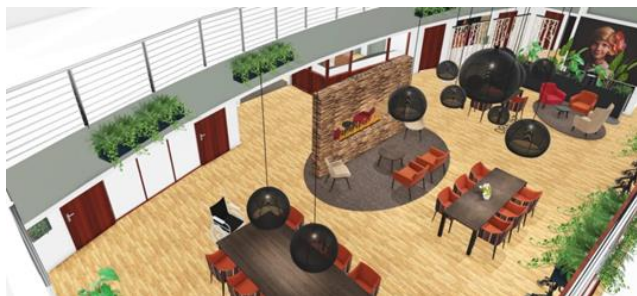
< Een impressie van het Atrium

Zoals u weet, krijgt de begane grond van De Raatstede een metamorfose. Zo worden de wanden voorzien van fraaie foto-afbeeldingen met een link naar Heerhugowaard en bewoners, er wordt geveerd en geklust. De werkzaamheden zijn 28 september gestart. Eind november is de klus geklaard. Vanwege de verbouwing van De Windsoos, De Overkant en het Atrium kan het zijn dat er voor activiteiten wordt uitgeweken naar andere ruimtes. Waar de activiteiten exact plaatsvinden, staat dagelijks te lezen op het mededelingenbord in het Atrium. Hou dit bord dan ook goed in de gaten! We doen uiteraard ons best om overlast zo veel mogelijk te voorkomen. Toch kunnen we enige hinder helaas niet uitsluiten. Onze excuses hiervoor.