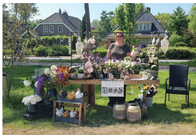
Tuinfair in Hugo-Waard