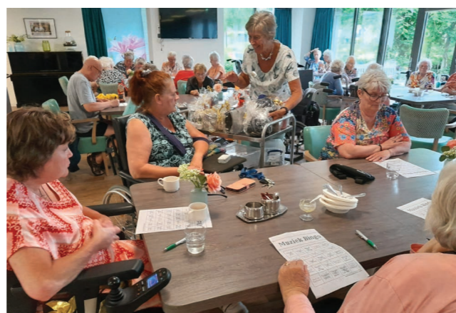
Muziekbingo en aardbeientraktatie Univé in Hugo-Waard