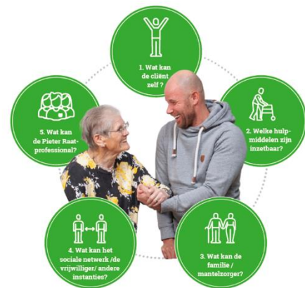
De 'Schijf van vijf' van eigen kracht

Senioren willen net als iedereen mensen ontmoeten en meedoen in de samenleving. Met het oog op het welbevinden van senioren, biedt Pieter Raat persoonlijke aandacht voor levensvragen alsmede een veilige omgeving met een gevarieerd activiteitenprogramma gericht op de verschillende behoeften van verschillende doelgroepen, intra- en extramuraal. Persoonsgericht welzijn kent een aantal voorwaarden. Senioren mogen bij Pieter Raat rekenen op respect voor de eigen identiteit en levensinvulling. Ook betreft Pieter Raat zo veel mogelijk het netwerk van senioren bij hun welbevinden.